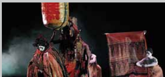
《醮》 Miroirs de Vie

雲門舞集是國內的旗艦團隊，作品無數。其中《九歌》這齣舞劇是雲門舞集二度與國際舞台設計泰斗李名覺合作，使用了畫家林玉山的畫作《蓮池》製景，並將樂池轉化為荷花池，鋪陳滿台荷花的景象，營造出《九歌》的恢宏氣勢。 (雲門舞集，1993 年 8 月首演)