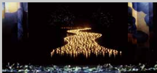
《九歌》 Nine Songs

觀眾將在大廳裡，看見一座由策展團隊重新搭建出來的國家戲劇院鏡框舞台，以大面玻璃為投影牆面，放映經典場景的影像，再搭配自動控制系統，讓場景中的立體物件與背景投影再現那些經典作品的美麗畫面。大廳兩側的迴旋樓梯則布置成經典服裝專區，將 25 年來曾在國家兩廳院舞台上款擺的長裙、飛揚的衣袖和件件襯著舞台人生即景的劇裝一一陳列，希望能在有限的空間中，儘量呈現劇場的多樣性。