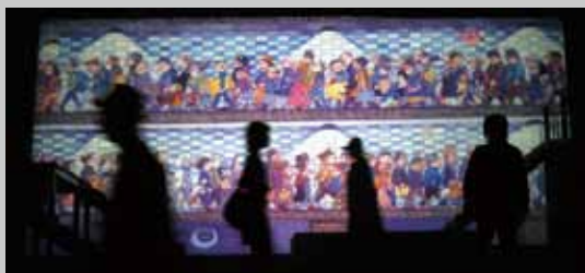
《地下鐵》 Jimmy's Sound of Colors

屏風表演班李國修的半自傳作品，結合了戲裡戲外的人生，反應戲臺下的人生即景，強烈的創作情感給予觀眾絕對的真實和震撼。 (屏風表演班，1996 年 10 月首演)