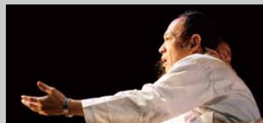
《如夢之夢》 A Dream Like A Dream

這是一場宛如道教祭典儀式般的舞作，在編舞家林麗珍十年磨戲的耐心之下，轉化民間儀式、藝術品與服裝，成為舞台上一幕幕震撼人心的場景，打造出劇場表演史上絕對的視覺悸動。 (無垢舞蹈劇場，1995 年 5 月首演)