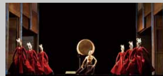
《洛神賦》 Luo Shen Fu - The Tale of the Luo River Goddess

國家戲劇院觀眾席與舞台空間關係的標準模式，在這部作品中被徹底打破，原本歌劇式的單面鏡框劇場被改造成四面觀戲的舞台，觀眾被包覆在四面舞台的中間，體驗完全不同的觀劇形式及視覺效果。 (表演工作坊，2005 年 4 月演出)