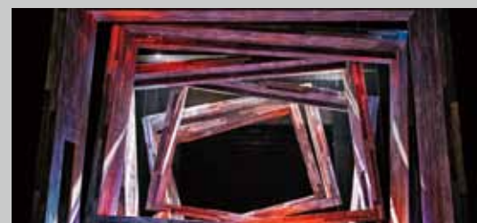
《福爾摩沙信箋－黑鬚馬偕》 The Black Bearded Bible Man

首次以幾米繪本改編而成的舞台劇，運用劇場的設備與表演，使原本二維空間的繪本世界，成功轉化成載歌載舞的美麗故事，拼貼出繪本裡天馬行空的意象空間，讓觀眾在虛實交錯之間，展開一場記憶與想像的冒險之旅。 (創作社劇團，2003 年 7 月首演)