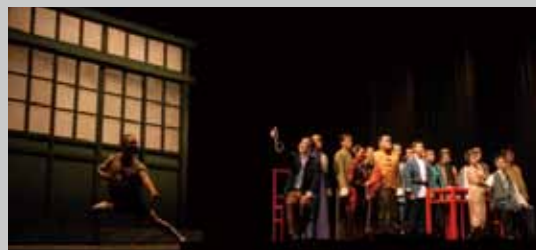
《京戲啟示錄》 Apocalypse of Beijing Opera

本劇是國家兩廳院首度與歐洲導演盧卡斯·漢柏合作，結合南管、中國文學及繪畫等題材，跨越古今，將南管安靜緩慢的音樂之美，注入當代劇場與文學結合的藝術風貌，製作出這齣精緻華麗的新浪漫南管樂舞劇。 (漢唐樂府，2006 年 5 月首演)