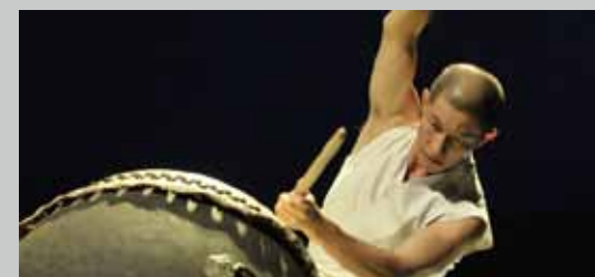
《入夜山嵐》 The Mountain Dawn

全球第一部以台語和英語雙語演唱的歌劇，舞台上六個幾乎佔滿表演空間的巨大方形鏡框，雖是國家兩廳院有史以來最重的舞台裝置，卻展現了最輕巧多變的質感，也標記了台灣劇場設計概念與技術執行的成熟。 (國立中正文化中心，2008 年 11 月首演)